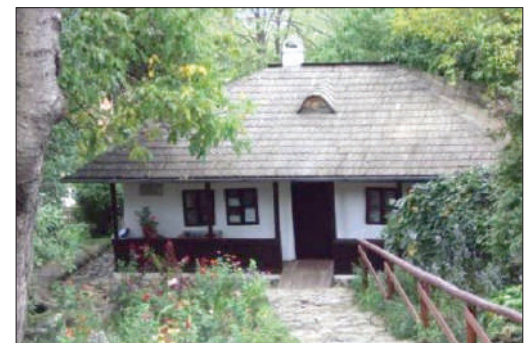
Bojdeuca lui Ion Creangă din Țicău

Nu trebuia să mire faptul că Mihai Eminescu avea în dotare un revolver, pentru că membrii Societății Carpații , din care făcea parte în calitate de membru fondator al acesteia, erau înarmați, Societatea având un caracter paramilitar.